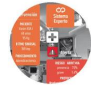
Apoyo a decisiones